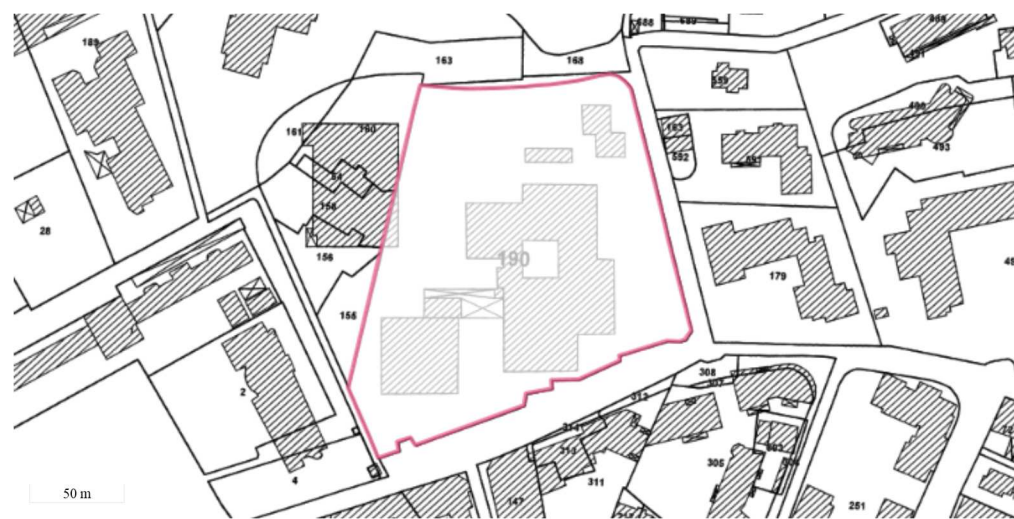
Périmètre du SIS Parcelles cadastrales - IGN